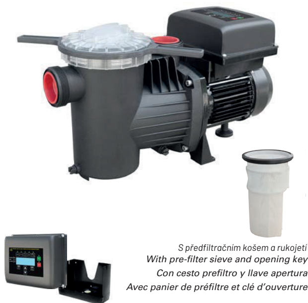
S předfiltračním košem a rukojetí With pre-filter sieve and opening key Con cesto prefiltro y llave apertura Avec panier de préfiltre et clé d'ouverture

Samovětraný stěnový držák (na vyžádání) Self ventiled wall support (on demand) Soporte en pared autoventilado (bajo demanda) Support mural auto-ventilé (sur demande)